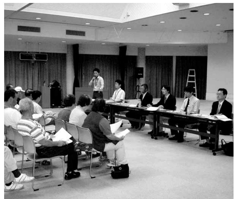
▲説明会の模様(6月23日:一宮ふるさとセンター)

平成22年12月28日(火)まで 【問合せ先】 総務省 地デジチューナー支援実施センター ☎0570-033840(ナビダイヤル) IP電話等をつながらない場合は☎044-969-5425 平日午前9時〜午後9時 土日祝日午前9時〜午後6時